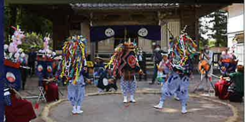
神戸獅子舞保存会