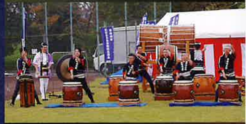
武蔵流東松山太鼓