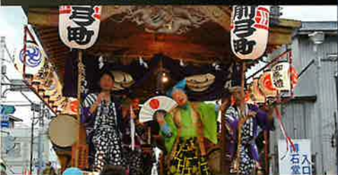
矢野町祭りばやし保存会