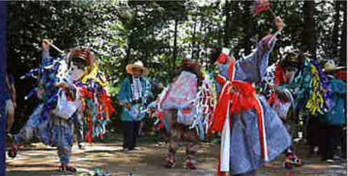
下唐子獅子舞保存会