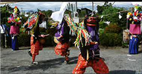
上野本獅子舞保存会