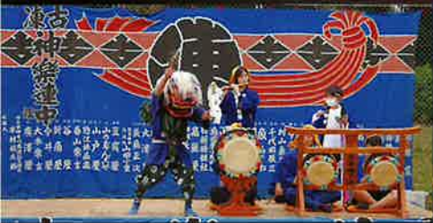
古凍祭りばやし保存会