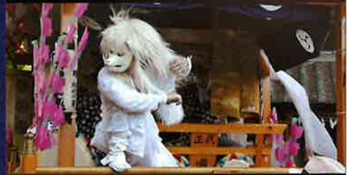
正代祭りばやし保存会