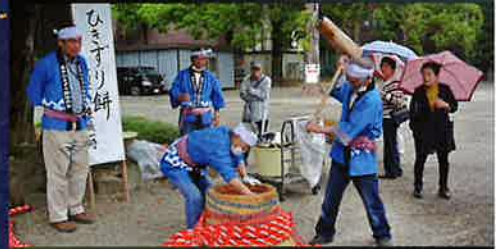
東平ひきずり餅保存会