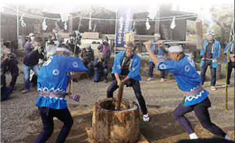
金谷餅つき踊り保存会