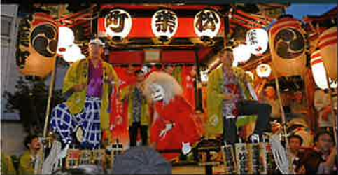
松葉町祭りばやし保存会