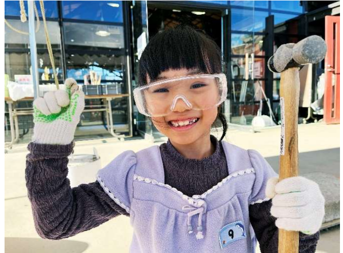
化石と自然の体験館賞 やったー！巻貝の化石発見！