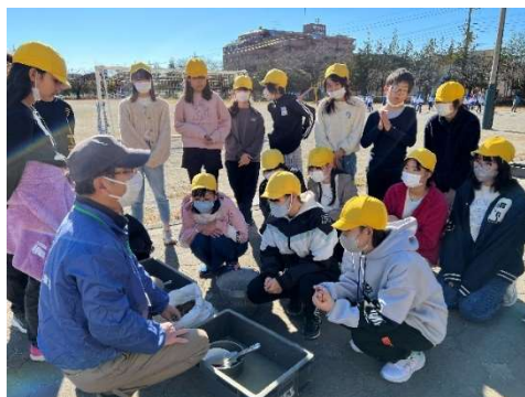
青鳥小学校での出前授業