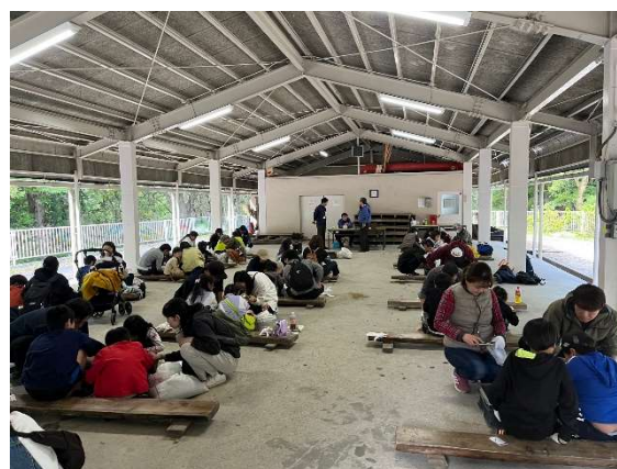
小川げんきプラザでの化石発掘体験