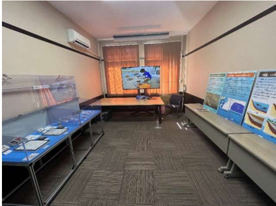
出張展示 展示室全景

・ボッシュ（株）東松山工場 Open Day 10月7日 来場者数 1,700人