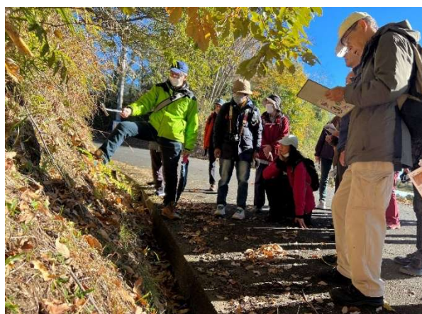
フィールドハイク ～嵐山溪谷をあるく～