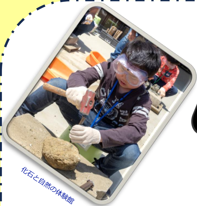
化石と自然の体験館