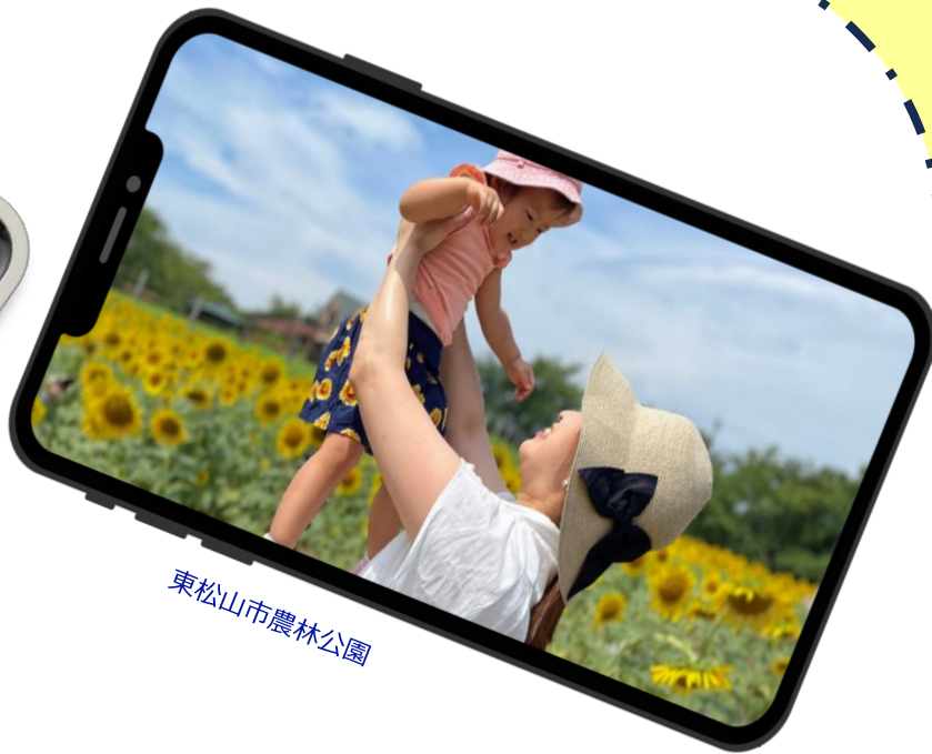
東松山市農林公園