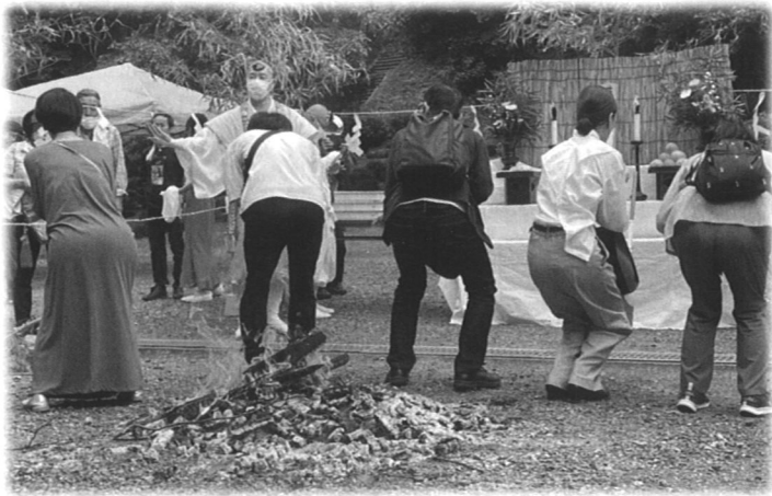
▶お護摩の炎でお尻をあぶり、お饅頭をガブリ!