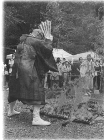
▶山伏がご祈祷します