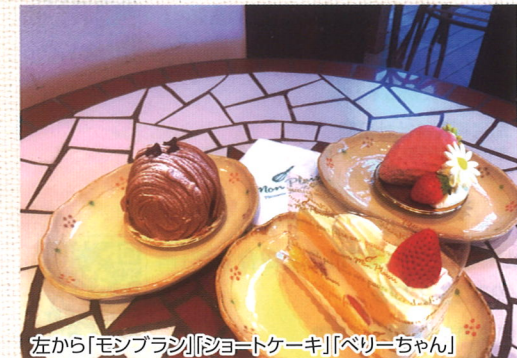
左から「モンブラン」「ショートケーキ」「ベリーちゃん」

甘いものが食べたくなったとき、ちょっとした喜びを感じたくなったとき、ひと息つきたいとき、そんなときには是非訪れてみてください。お店を出る時には、きっとあなたも笑顔になっているはずです。