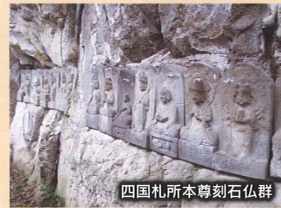
四国札所本尊刻石仏群