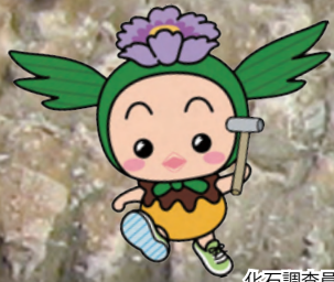
化石調査員 まっくん