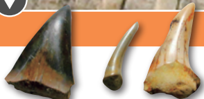
発掘されたサメの歯の化石