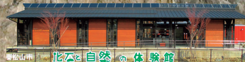
東松山市 化石と自然の体験館