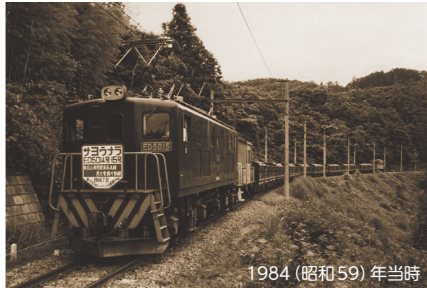
1984 (昭和59) 年当時

かつて太平洋セメント(株)と秩父鉱業(株)の貨物専用路線として運用されていた廃線敷は、まなびの要素を取り入れた観光拠点をつぶ遊歩道として整備され、楽しく学び歩くことができる周遊ルート『まなびのみち』として生まれ変わりました。