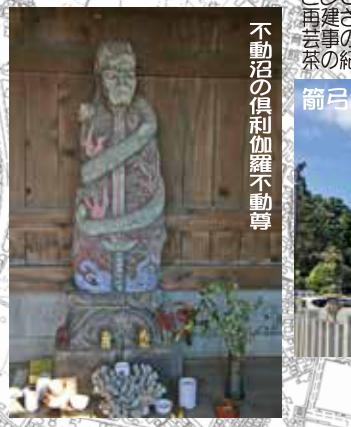
不動沼の信利伽羅不動尊

江戸時代後半に商売繁盛、招福厄除祈願として栄えた。現在の社殿は大保年間に再建されたもので、見事な彫刻が見られる。芸事の神様でも有名な、十辺舎一丸、小柳一茶の紀行文にも登場している。