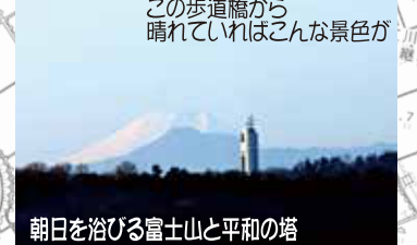
朝日を浴びる富士山と平和の塔