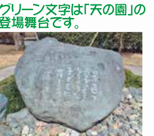
「天の園」記念碑 (唐子中央公園) 2001年5月たぐさんの市民の手で建立されました