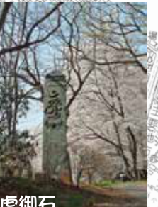
虎御石 高さ375cm薬研彫りの見事な青石塔婆(市指定考古資料)