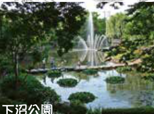
下沼公園 下沼巡礼坂の観音信仰の悲話が残る

江戸時代後半に商売繁盛、招福厄除祈願として栄えた。現在の社殿は大保年間に再建されたもので、見事な彫刻が見られる。芸事の神様でも有名な、十辺舎一丸、小柳一茶の紀行文にも登場している。