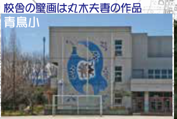
校舎の壁画は丸木夫喜の作品 青鳥小