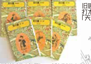
旧唐子村を舞台に描かれた打木村治の代表作「天の園」全6巻(借成社文庫)