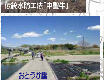
伝統水防工法「中聖牛」