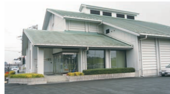
埋蔵文化財センター 川越駅(八幡団地経由)行きバス柏崎下車徒歩15分 【休】土・日・祝 年末年始 TEL 0493-27-0333

東松山市には、先人が残した数多くの遺跡が存在します。展示室では、市内の遺跡を代表する出土品を年代順に展示し、開放廊下からは整理作業の様子を見ることができます。