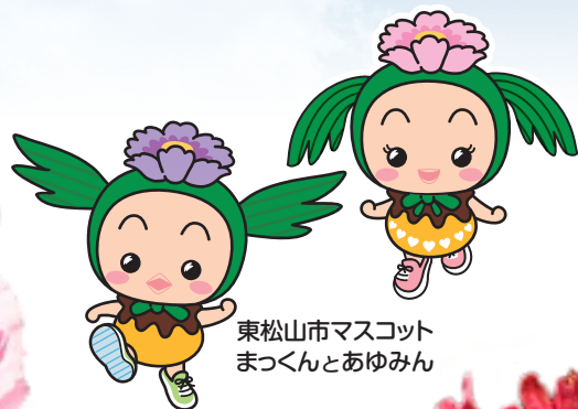
東松山市マスコット まつくんとあゆみん