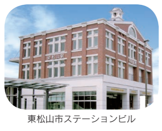
東松山市ステーションビル