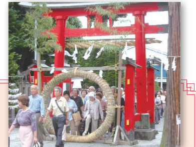
茅の輪くぐり(箭弓稲荷神社)

毎年12月15日に大鳥神社で行われる西の市です。露店が立ち並び、威勢の良い掛け声が飛び交うなか、縁起ものの熊手などを求めて大勢の人が訪れます。年末の風物詩です。