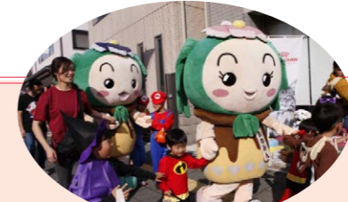
ハロウィンウォーク