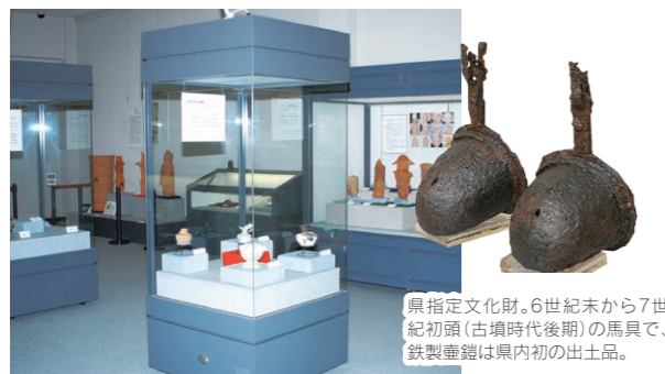
県指定文化財。6世紀末から7世紀初頭(古墳時代後期)の馬具で、鉄製垂鐘は県内初の出土品。

古代の人々の生活が営まれてきた遺跡は市内に約300箇所あります。中世では鎌倉幕府樹立の推進力となった比企氏のゆかりの土地でもあり、鎌倉時代の遺跡や伝説が数多く残っています。唐子地区で幼少時代を過ごした打木村治の児童文学「天の園」が都幾川の清冽な流れの中で彷彿としてよみがえります。