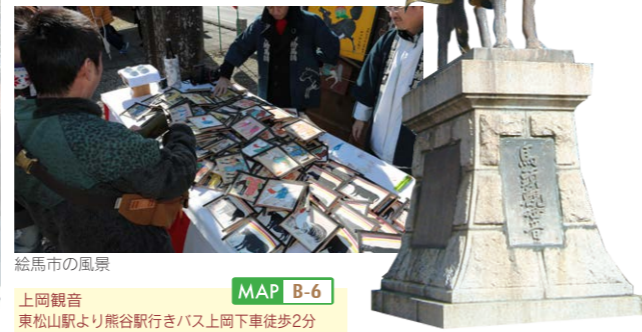
絵馬市の風景 上岡観音 東松山駅より熊谷駅行きバス上岡下車徒歩2分 MAP B-6

馬頭観音としては関東随一の霊場と言われている。毎年2月19日に行われる例大祭には牛馬を描いた絵馬を売る市が立ちます。昔は農家の人たちが賑わいましたが、今では、競馬場や乗馬クラブの関係者が多く訪れ、馬の守り観音として信仰を集めています。