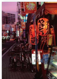
H18観光写真真コンテスト 入選作品